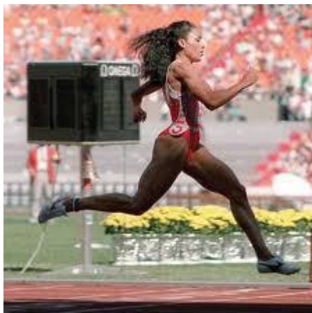
Φλόρενς Γκρίφιθ Τζόινερ

θάνατό της, είχε υποστεί άλλα τρία εγκεφαλικά και τουλάχιστον ένα καρδιακό επεισόδιο.